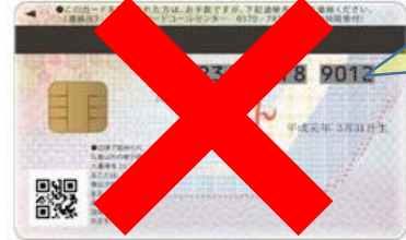
【裏面】マイナンバーカード見本