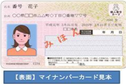
【表面】マイナンバーカード見本