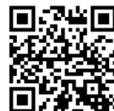
生涯学習センターHP