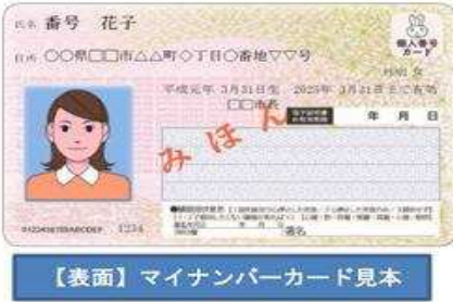
【表面】マイナンバーカード見本