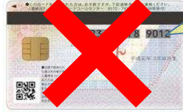
【裏面】マイナンバーカード見本